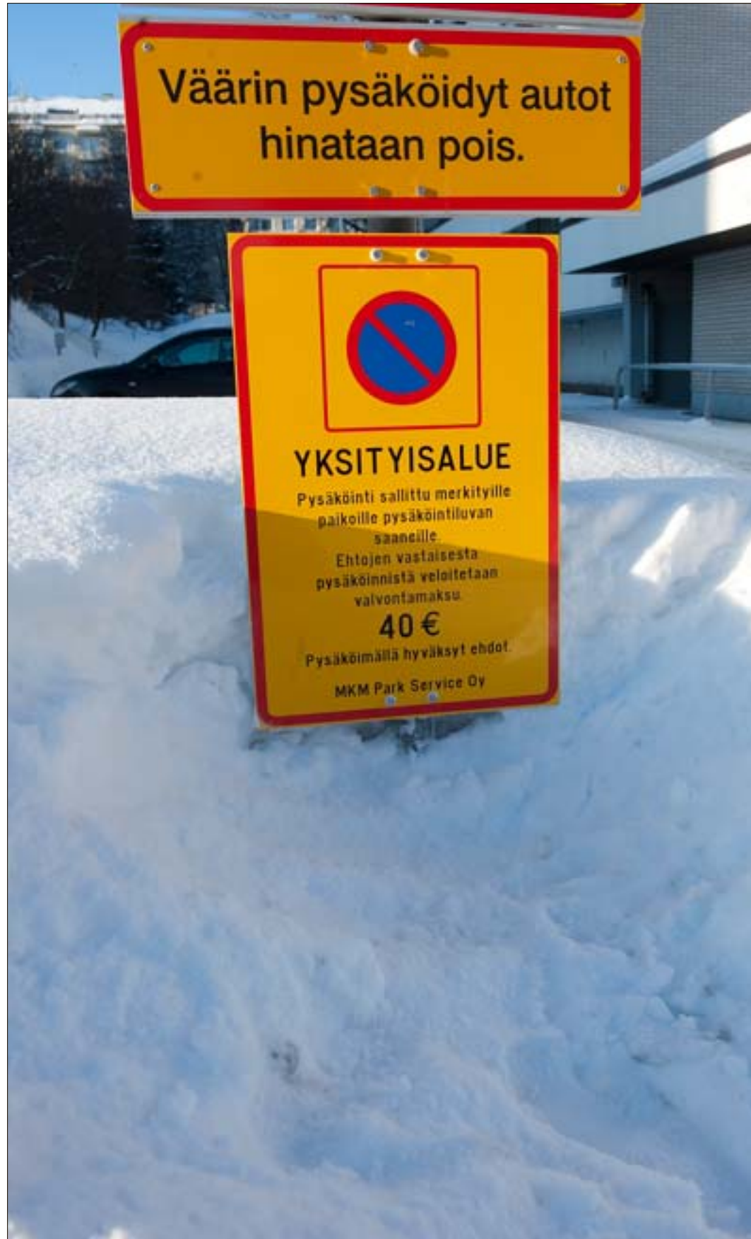
BISNES JATKUU Tilanne yksityisessä pysäköinninvalvonnassa jatkuu entisellään, vaikka eduskunnan lakivaliokunta hylkää lakiesityksen.

Jyväskylässä toimii useita yksityisiä pysäköinninvalvontayrityksiä. MKM Park Servicen valvonnassa Jyväskylässä on yli 300 taloyhtiön pysäköintialueita. Yrityksellä on kohteita myös Laukaassa, Muuramessa ja Tikkauskoskella.